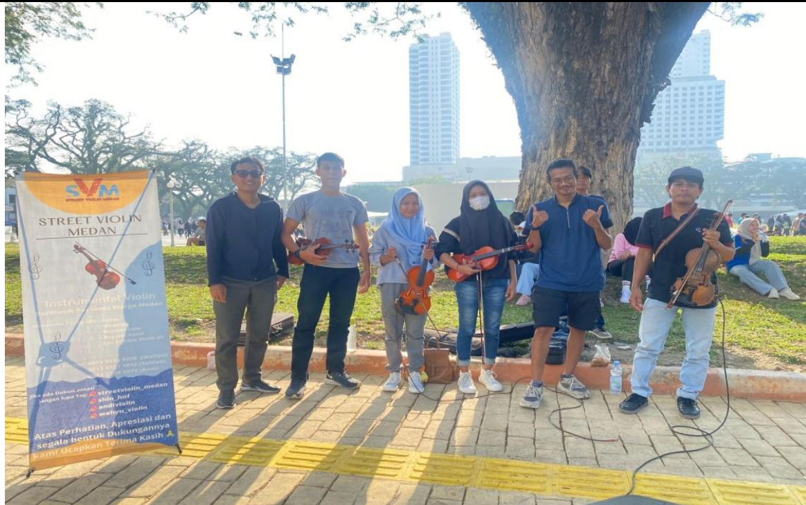
Gambar 2. Peneliti Bersama Pemain Biola Jalanan Otodidak (Dokumentasi Pribadi, 2025).

Pertama, SPMI berkontribusi dalam membangun kesadaran identitas diri sebagai musisi. Sebelum bergabung dengan komunitas, sebagian besar pemain biola jalanan memandang aktivitas bermusik hanya sebagai sarana untuk memenuhi kebutuhan ekonomi jangka pendek. Perspektif ini cenderung membatasi potensi perkembangan diri karena berorientasi pada survival semata. Namun, setelah terlibat dalam aktivitas komunitas SPMI, terjadi perubahan cara pandang yang cukup signifikan. Para pemain mulai menyadari bahwa mereka merupakan bagian dari pekerja seni yang memiliki nilai estetika, kreativitas, dan potensi profesional. Transformasi identitas ini memperkuat konsep diri ( self-concept ) sebagai musisi, sehingga mereka mulai memiliki visi jangka panjang, seperti keinginan untuk tampil di panggung yang lebih besar, mengajar musik, atau mengembangkan karya sendiri. Perubahan orientasi ini menunjukkan peningkatan efektivitas hidup dari sekadar bertahan menuju pengembangan diri yang berkelanjutan. Informan ST (20 tahun, pemain biola otodidak) mengungkapkan perubahan paradigma tersebut: